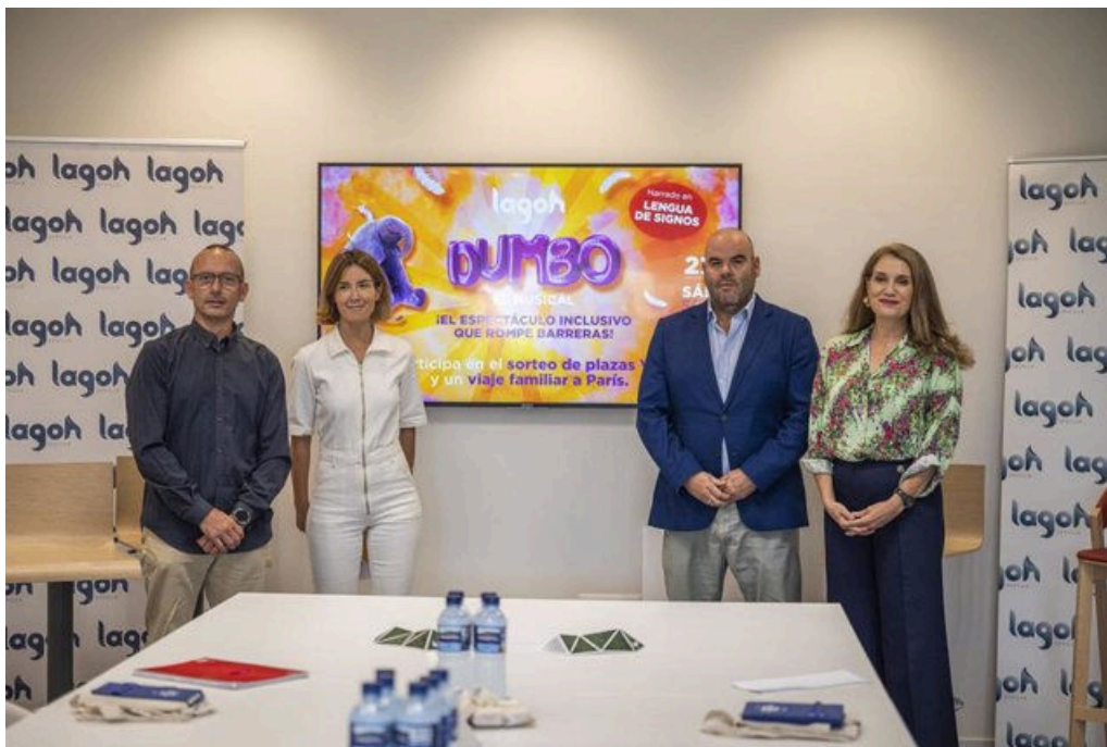
El centro comercial Lagoh homenajea a las asociaciones de Integración Sordo-Oyente y de Síndrome de Down