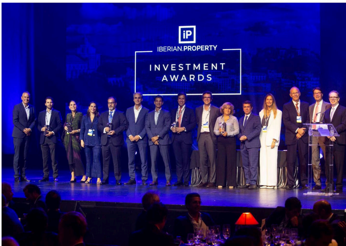
Todos los ganadores de los Iberian Property Investment Awards 2023.

El pasado 19 de septiembre, el Casino de Estoril, en Lisboa, acogió a más de 400 profesionales del sector inmobiliario de España y Portugal para celebrar la gala de entrega de los Iberian Property Investment Awards 2023 . Estos premios, organizados por la plataforma Iberian Property, reconocen las mejores inversiones y buenas prácticas en el mercado ibérico durante el año 2022.