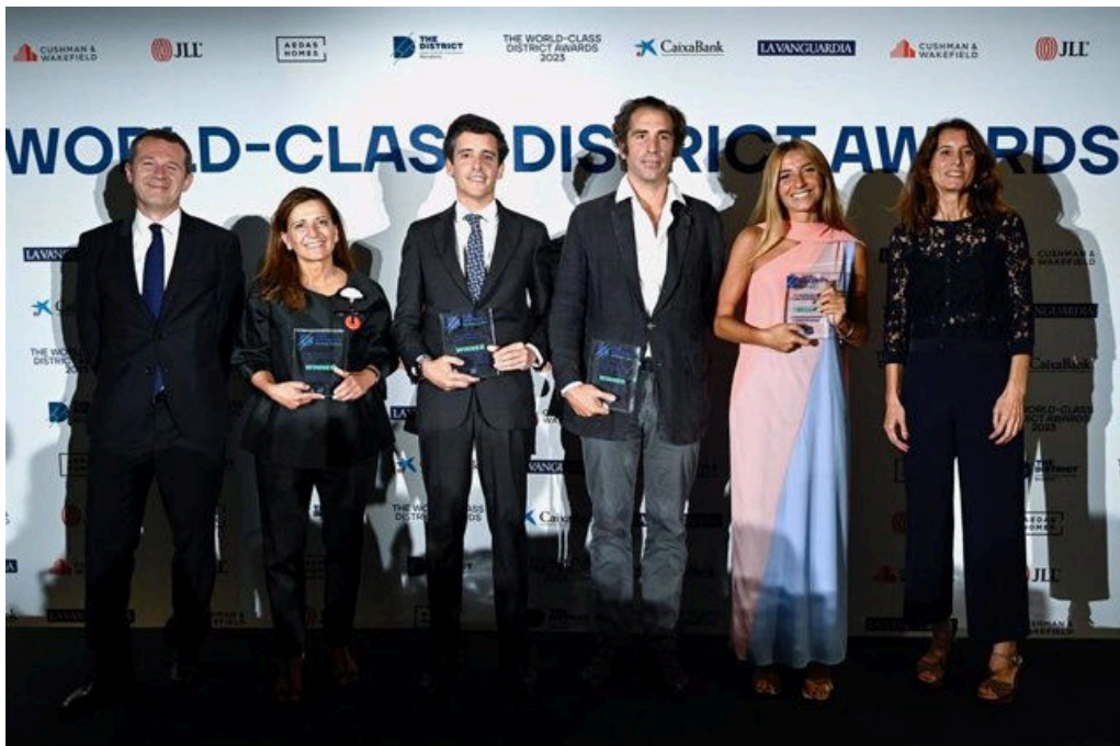
Los World-Class District Awards premian "iniciativas disruptivas" de actores del Real State