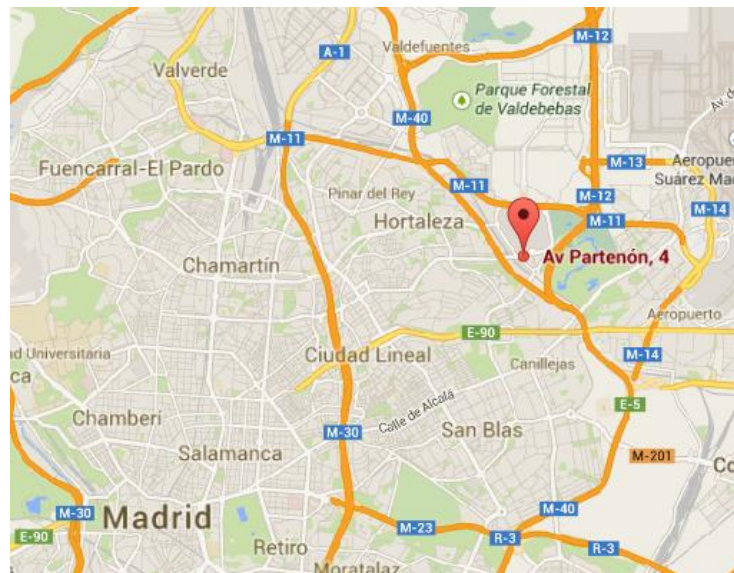
Localización del inmueble en el área periférica de Madrid

El edificio Egeo, situado en la avenida Partenón 4-6, a 7 kilómetros del Paseo de la Castellana, cuenta con una magnífica ubicación dentro del área periférica de la ciudad de Madrid, así como con excelentes comunicaciones por transporte público (Metro Campo de las Naciones a 200 metros y autobuses 112, 122 y 828) y un