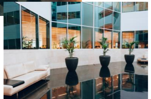
Hall de acceso