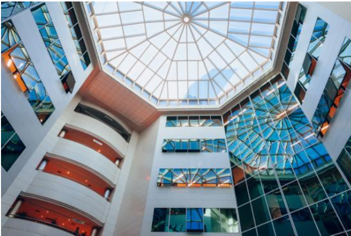
Interior del edificio Egeo

Con esta operación de la SOCIMI gestionada por Grupo Lar se han invertido ya 297,4 millones de euros de los 400 captados en la salida a bolsa, de los que 165,3 millones se han destinado a cinco centros comerciales situados en Irún, Palencia, Albacete, Barcelona y Alicante; 78,1 millones a tres edificios de oficinas en Madrid; 44,9 millones a 8 naves logísticas en Guadalajara; y 9,1 millones a una mediana comercial en la capital.